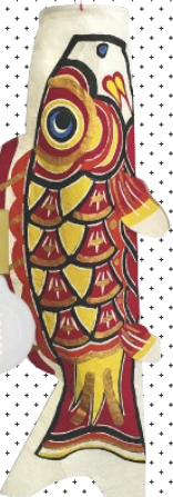
DEN HABEN WIR AM HAKEN „Medium Washipaper Koifish“, ca. 32 Euro, ohayo.dk