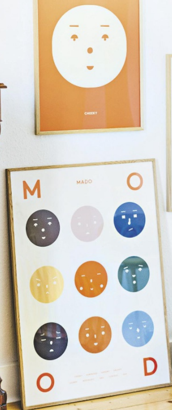
Luisas Liebe zu Farbkombinationen mit Blau-Rot und Orange währt schon ewig

COUCH COMMUNITY HAUSTOUR Checkt doch mal Luisas Account how.luisa.lives aus und werdet selbst Teil der Community; auf couchstyle.de