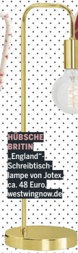
HÜBSCHE BRITIN „England“-Schreibtischlampe von Jotex, ca. 48 Euro, westwingnow.de