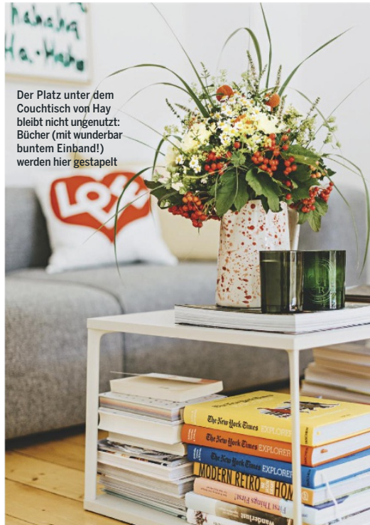
Der Platz unter dem Couchtisch von Hay bleibt nicht ungenutzt: Bücher (mit wunderbar buntem Einband!) werden hier gestapelt