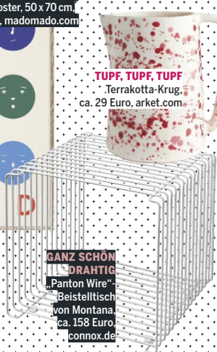
GANZ SCHÖN DRAHTIG „Panton Wire“-Beistelltisch von Montana, ca. 158 Euro, connox.de