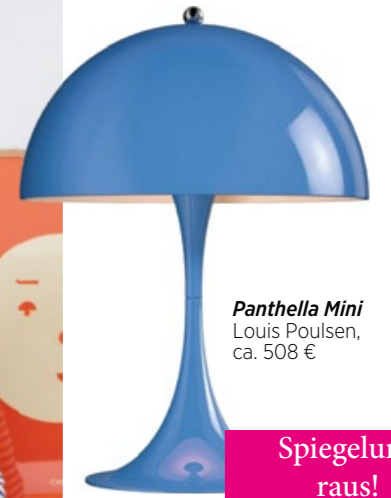
Panthella Mini Louis Poulsen, ca. 508 €

„MEIN LEBEN SOLL RICHTIG SCHÖN BUNT SEIN!“