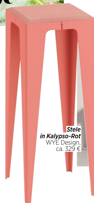
Stele in Kalypso-Rot WYE Design, ca. 329 €

„AN BOHO, PAMPASGRAS UND WOHNUNGEN OHNE PERSÖNLICHKEIT HABE ICH MICH BEI INSTAGRAM SATTGEGEHEN“