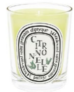
Duftkerze Citronelle, Diptyque ca. 52 €