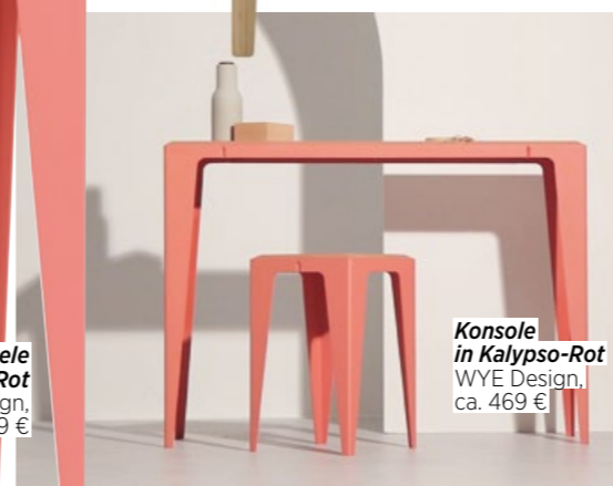
Konsole in Kalypso-Rot WYE Design, ca. 469 €