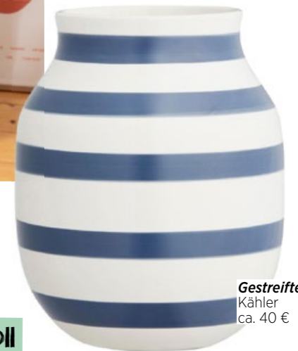
Gestreifte Vase, Kähler ca. 40 €