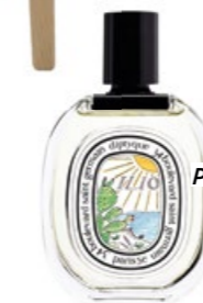
Parfum Ilio - perfekt als Raumduft! Diptyque, ca. 112 €