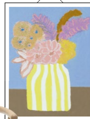
Poster Striped Vase Jennie Petersen über wallofart.com, ab ca. 29 €