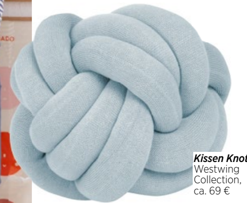
Kissen Knot Westwing Collection, ca. 69 €