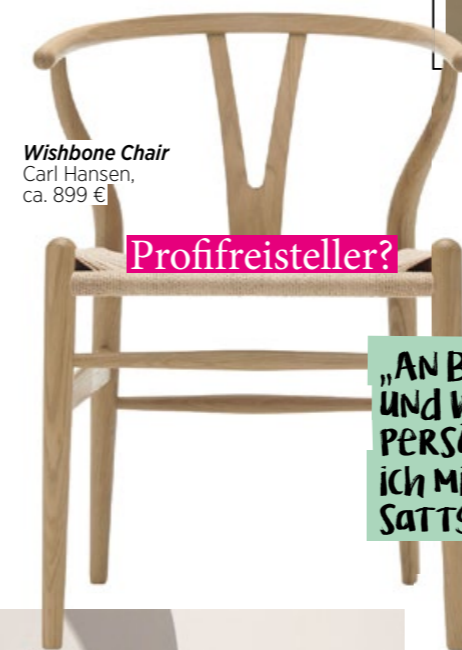
Wishbone Chair Carl Hansen, ca. 899 €