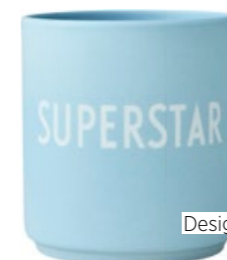
Becher Designletters, ca. 21 €

Als Einrichtungsberaterin hilfst du auch anderen Menschen dabei, ihre vier Wände zu einem Wohlfühlort zu machen. Wie schaffst du es, dich in den Stil eines anderen hineinzusetzen? Zuhören! Wer wohnt in den vier Wänden, was stört die Bewohner und was ist ihnen wichtig. Dann interessiert mich, was den Bewohnern vor ihrem inneren Auge vorschwebt. Ich liebe diesen Teil meiner Arbeit, da ich so viel auch über das wirkliche Innere einer Person erfahre und so nach und nach das Zuhause für sie gestalten kann. Alles nach dem Leitspruch „Create a home you love“!